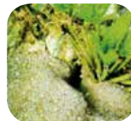
Meist offenes Loch